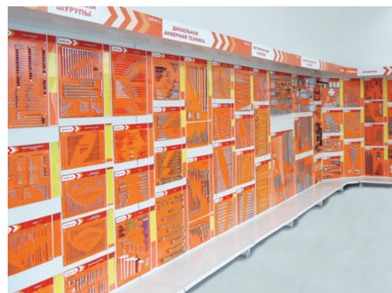
Фирменный готовый отдел крепежа

Сегодня основные регионы сбыта для компании Bohrer — это ЦФО, СЗФО и республика Беларусь. Активно ведётся работа по развитию продаж на других территориях России. В 2016 году запланировано открытие филиалов со складами и командами по развитию и управлению взаимоотношениями с потребителями в двух новых регионах, а также углубление присутствия компании на существующих территориях.