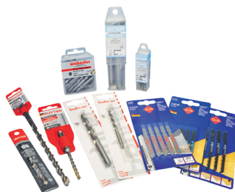
Импорт качественной европейской оснастки