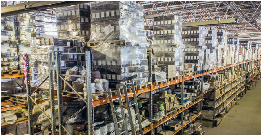
Складские площади более 10000 м 2

В ассортименте Bohrer представлен широкий диапазон продуктов, рассчитанных и на клиентов, только создающих свой бизнес с нуля, и для крупного оптового канала.